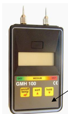
Рисунок 2 – Общий вид влагомеров серии GMH (модификация GMH 100)

Место для нанесения оттиска поверительного клейма