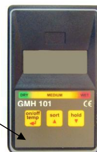
Рисунок 3 – Общий вид влагомеров серии GMH (модификация GMH 101)

Место для нанесения оттиска поверительного клейма